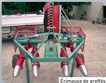
Écimeuse de greffés