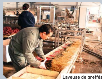
Laveuse de greffés